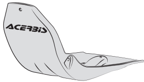
A - (1 PCS)